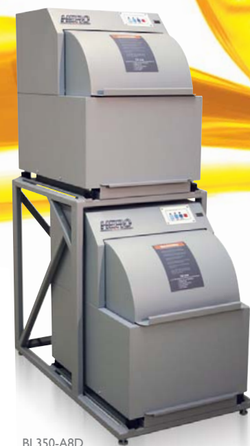
BL350-A8D Support double