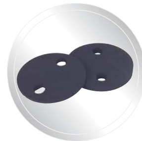
Coussinet 3/4" épaisseur HL473235